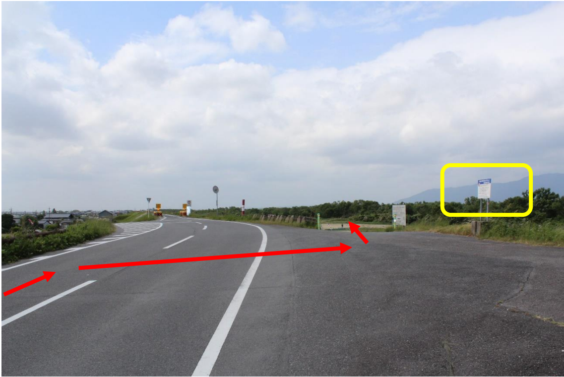
80mほど直進すると右手がグラウンド入口です。“東海大橋木曾川グラウンド”看板が目印です。