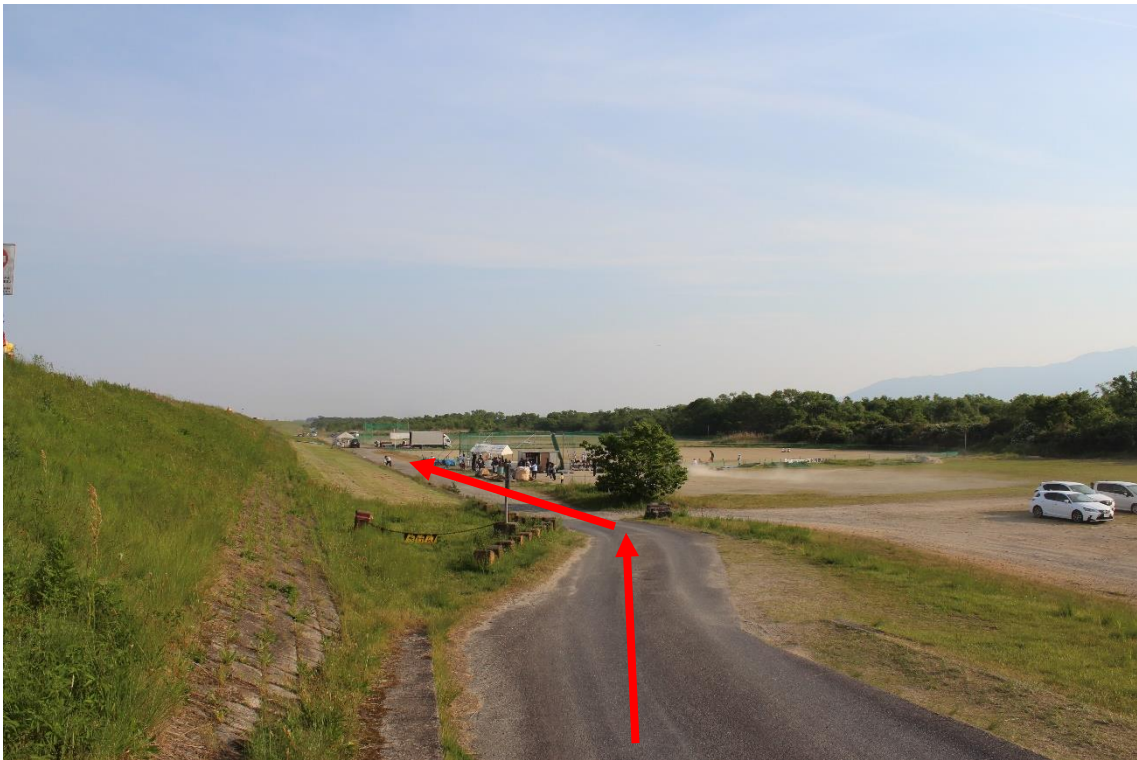
200m程直進した南奥のグラウンドが尾張ボーイズ専用グラウンドです。